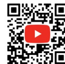
EURODIMA Wandsäge WM50 / WM90 Aufbau und Funktionstest